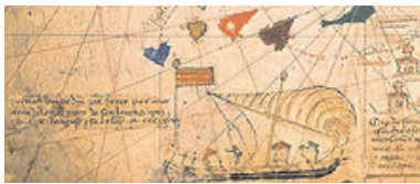
Detalle de Jaume Ferrer al'Atlas Catalán (1375)

Jaume Ferrer (Mallorca, siglo XV) fue un navegante mallorquín, que se ha identificado documentalmente con el ciudadano de Mallorca del mismo nombre que en 1343 llegó con un barco en el puerto de Brujas.