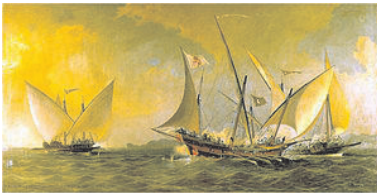
Jabeques de Antonio Barceló luchando contra galeotas corsarias argelinas. 1738

En 1748 causó un gran revuelo el apresamiento por parte de los berberiscos de un jabeque español con 200 pasajeros, entre ellos 13 oficiales del ejército. Molesto, el nuevo rey, Fernando VI, ordenó armar en Mallorca a sus expensas cuatro jabeques, dándole el mando a Antonio Barceló, que fue ascendido a teniente de fragata el 4 de mayo de aquel año.