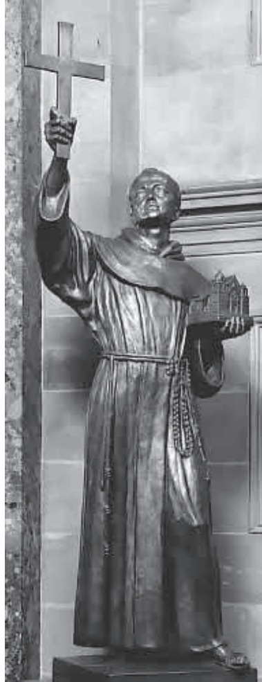
Fray Junípero Serra. Escultura en The National Statuary Hall

Una vez que arribó la comitiva a la península, determinaron seguir explorando la Alta California para llevar la "luz del Evangelio" a la población indígena que, al contrario de la población de México, no conocían la agricultura, salvo en algunas zonas del desierto; su alimentación se limitaba a la recolección de frutas y raíces silvestres, bellotas, la cacería de venados, alces y conejos, y la pesca. No acostumbraban usar la vestimenta y para protegerse del frío cubrían sus cuerpos con pieles de venado, plumas, capas de piel de nutria y barro.