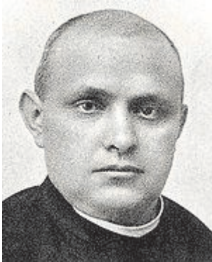
Antoni Maria Alcover.