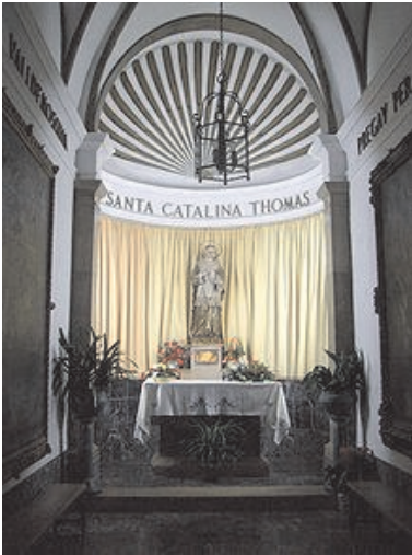
Capilla de Santa Catalina Tomàs en su casa natal de Valldemossa (Mallorca)

Santa Catalina Tomàs (o Thomàs en ortografía mallorquina antigua) (Valldemosa, España, 1 de mayo de 1531 - Palma de Mallorca, 5 de abril de 1574), fue una religiosa española y santa de la Iglesia Católica. Su fiesta se celebra el 5 de abril.