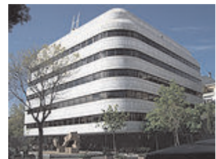
Sede actual de la Fundación Juan March, en Madrid